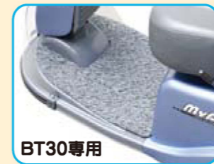
フロアマット BT30専用